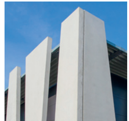
Übereckenschlüsse – eine individuelle und passgenaue Lösung.

Nach den intensiven und gründlichen Vorplanungen ging es dann im November 2017 an die Produktion. Zunächst entstanden 24 verschiedene Formen, die dann nacheinander für insgesamt 59 Bauteile ausgegossen wurden. Die Fassadenbauteile verfügen über Abmessungen von 1,50 bis 3,25 m Breite und 8,50 m Höhe. 3,8 m 3 Beton fasst eine Form im Durchschnitt. Insgesamt ergab das letztlich ein Volumen von 225 m 3 Beton, der eingesetzt wurde. In jedes einzelne Bauteil wurde